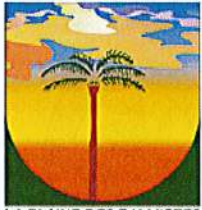
LA PLAINE DES PALMISTES